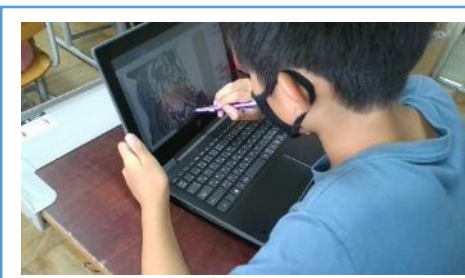
写真2：タッチペンを使って、彩色している場面