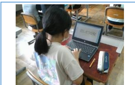
写真1：作品を鑑賞し、題名を考えている場面