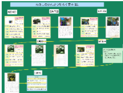
写真2：国語科「かんさつ名人になろう」では記録文を原稿用紙に書き、メモアプリでスキャンして、観察メモと共に、ロイロノートに整理している。(デジタルポートフォリオ)