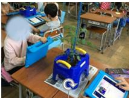
写真1：ロイロノートで観察メモをしている場面