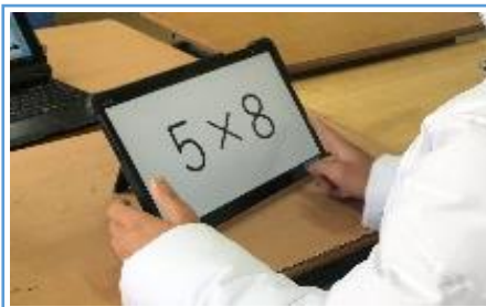
写真 1:フラッシュカードでの掛け算の練習の場面