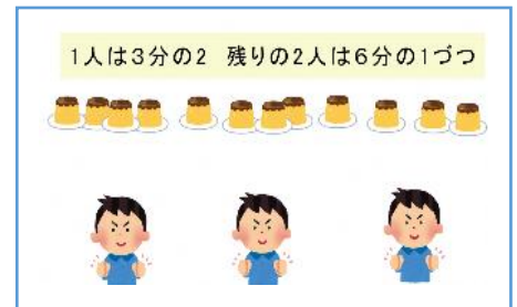
写真 3:整数の物体が分数で表された際に対応できるかを確認する問題（分数の学習③）