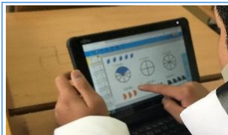
写真 2:分数の図形を当てはめている様子