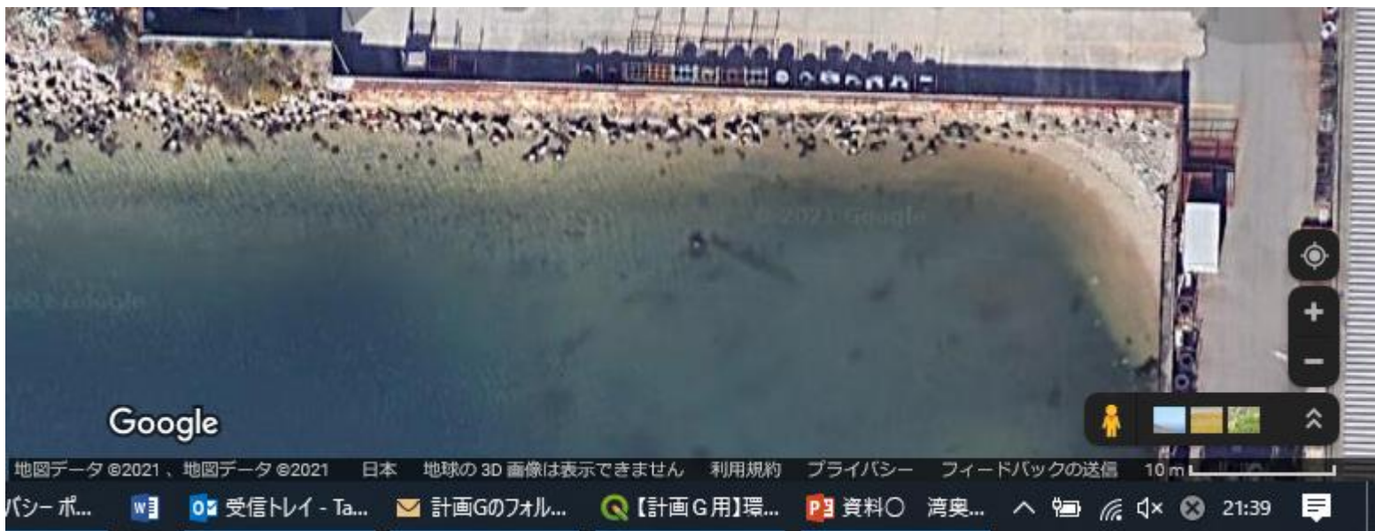
砂の堆積がみられる水域