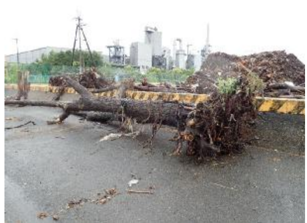
（参考）以前漂流していた木