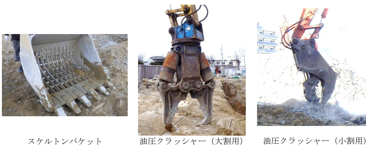
図 1 調査対象としたアタッチメントの種類