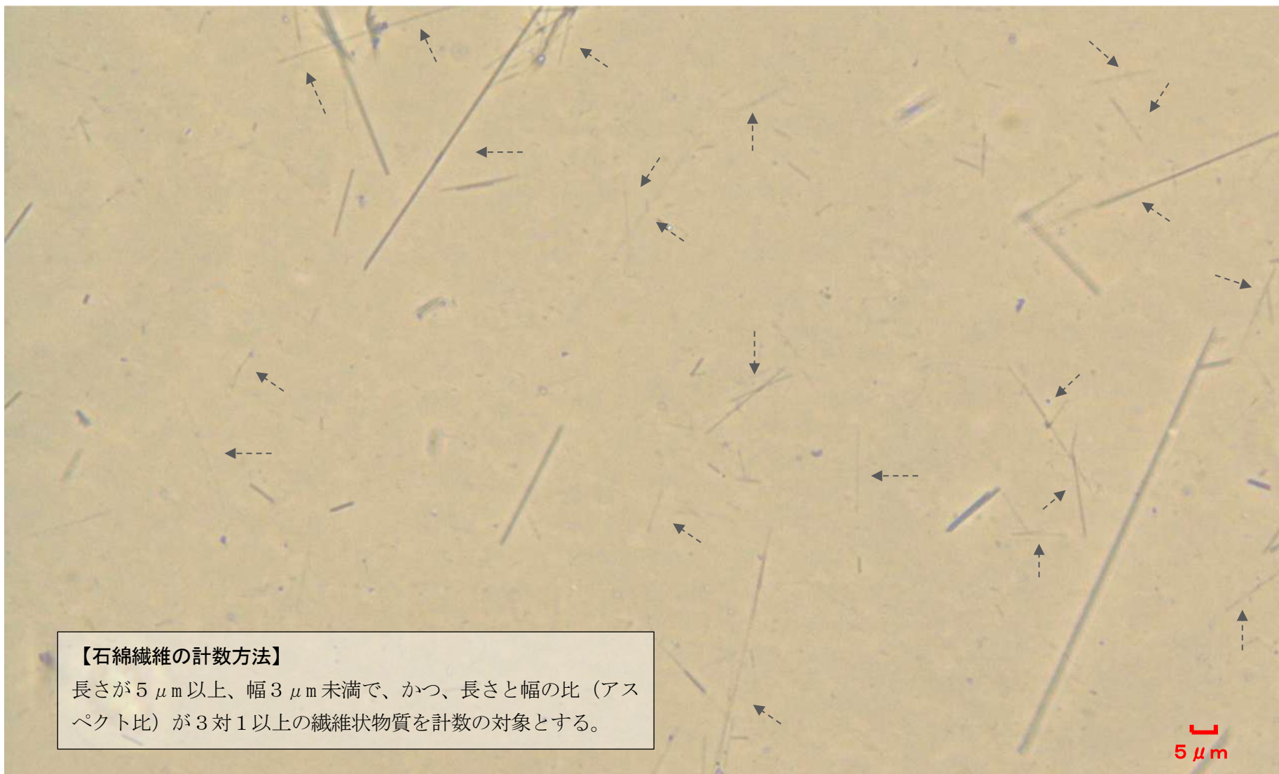
アモサイト（茶石綿）（測定倍率 400 倍）