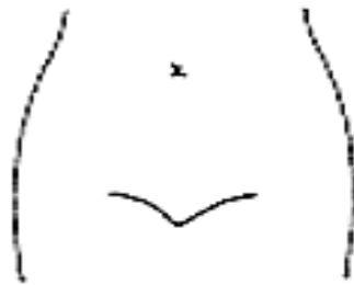
(ストマ及びびらんの部位等を図示)