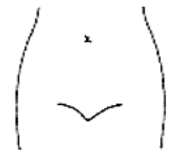
(腸瘻及びびらんの部位等を図示)