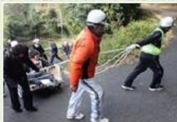
避難行動要支援者が災害時に避難する際のイメージ