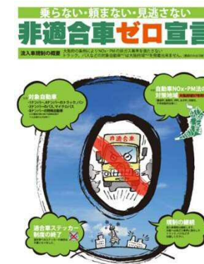
非適合車ゼロ宣言 チラシ