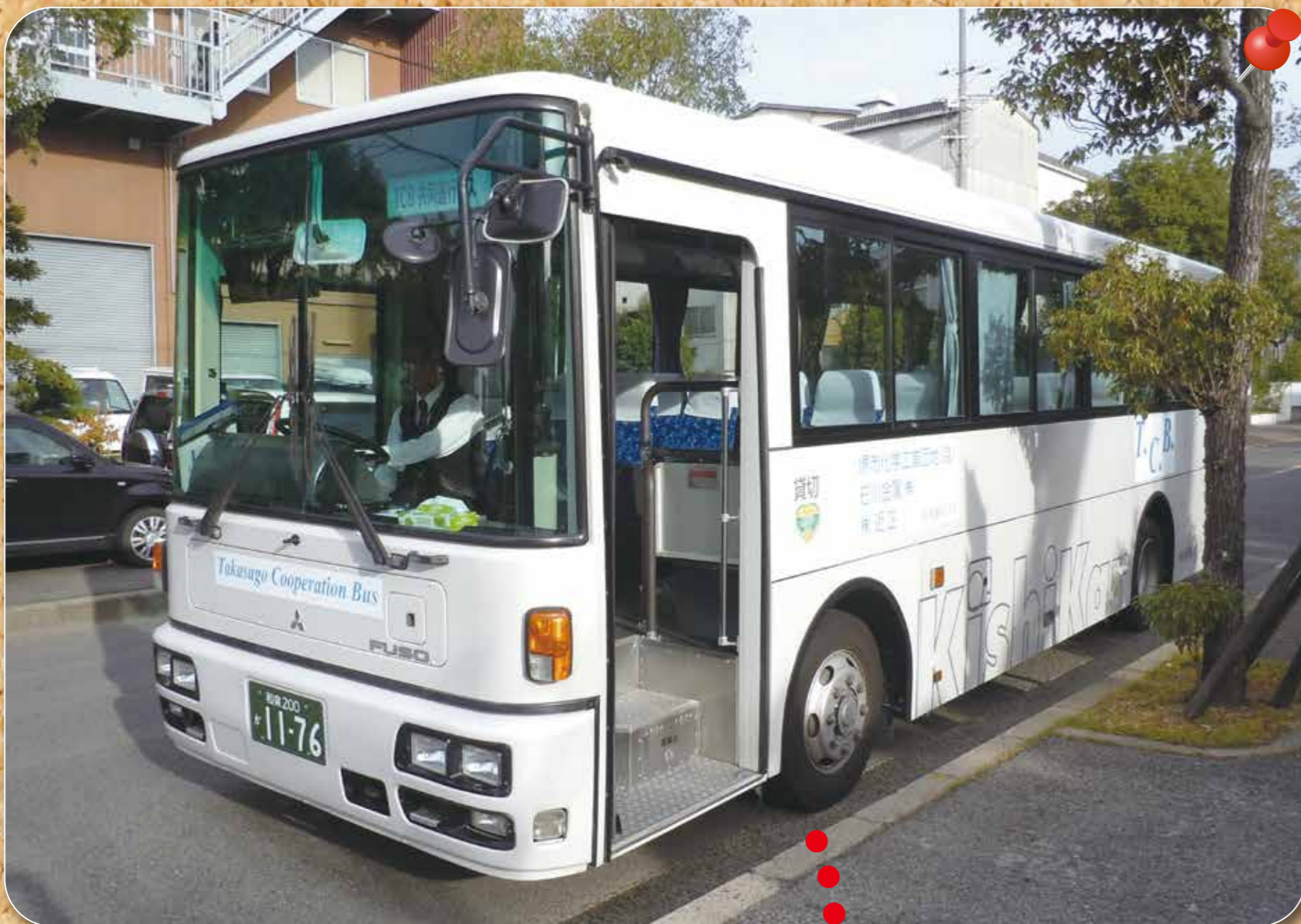
バスをチャーターして通勤に使用

今後、近隣2企業と共同運行を予定しており、従来の3台(組合+2社)での運行を、中型1台での運行に切り替え、便数増加と利用料金の引き下げを行っていく。