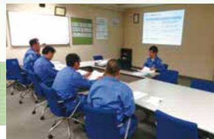
講習、面談を積極的に行い、スキルの向上に努めている。