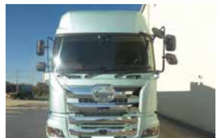
直近3年間で10台の新車を購入し、燃費向上に努めている。