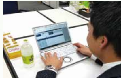
車両管理システムに入力して、運転日誌を作成。