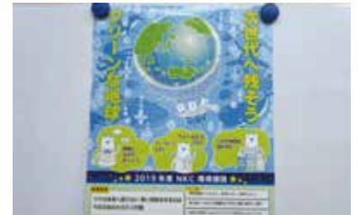
環境保全行動の標語や「私のエコライフ」を 従業員から募集し、優秀作を表彰。