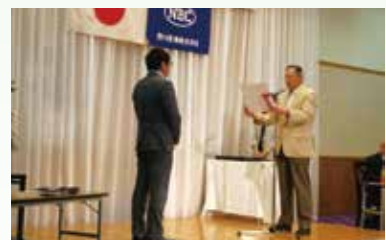
燃費目標を達成した社員を記念総会で 賞状と金一封をもって表彰。