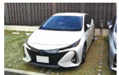
プラグインハイブリッド自動車をまめに充電し ガソリン給油量を削減。

②デジタルタコグラフ : 急加速、急減速、エンジン回転数、アイドリング時間などのデータをメモリーやクラウドで管理できます。