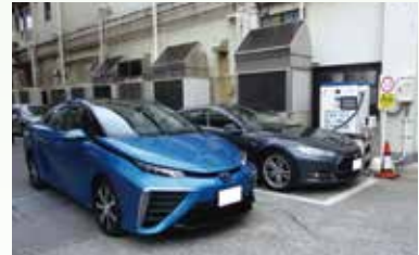
天満地区の社用車は全車エコカーとなっている。 (左:燃料電池自動車、右:電気自動車)