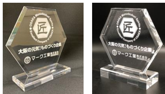
(9-1) 厚み 10mm (9-2) 厚み 20mm