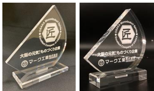
(8-1) 厚み 10mm (8-2) 厚み 20mm