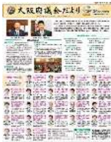
[令和 3 年 7 月号]