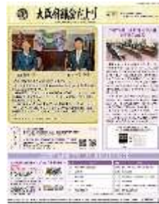
[令和 4 年 1 月号]