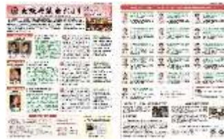
[令和 3 年 12 月号]