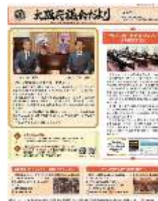
[令和 5 年 1 月号]