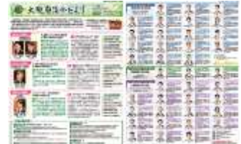
[令和 4 年 4 月号]