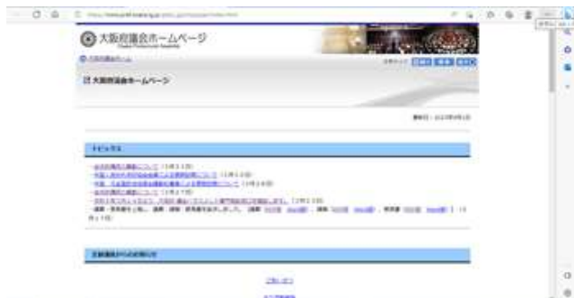
[大阪府議会ホームページ]