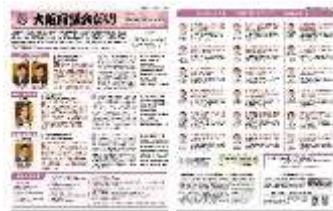
[令和 4 年 12 月号]