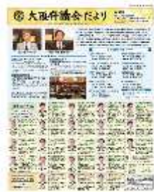
[令和 4 年 7 月号]