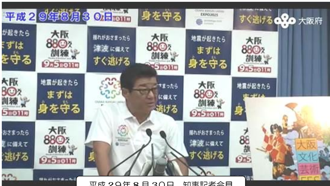
平成 29年 8月 30日 知事記者会見