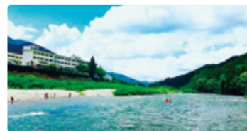
高知県 こうちけんりつれいほく 高知県立嶺北高等学校

島まるごと学校。「グローバル人材」を目指して、日本一の多様性のなかで学ぶ。スローガンは「失敗を共に称え合う学校」