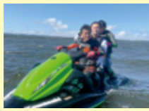
網走湖で友人と水上バイク

知床、斜里町の地域の中では様々な出会いがありました。学校の友人はもちろんのこと、アルバイトで出会ったお客さん、地域の活動への参加などを通して、多様な人の「生活」や「考え方」を知ることができました。留学の中で「自分とのちがいが」がおもしろいと興味を持つことができたことが、貴重な経験だったと感じます。慣れた環境から出て留学に挑戦することで、色々な経験をして成長することで考え方も変わりました。留学での経験や学んだことはこれから先の人生で活かされてくるものだと思います。