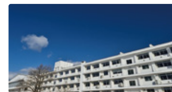
岩手県 しまねけんりつおき 岩手県立隠岐高等学校

好奇心のタネを発見し、やってみる。そんなあなたの一歩に寄り添います。人の厚さと出会いの数にきっと驚く、まち全体が学びの場。