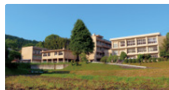
岩手県 しまねけんりつみとや 岩手県立三刀屋高等学校

子どもから大人までチャレンジが連鎖する雲南で地域を感じ、マイテーマを深化させるスペシャルな365日。