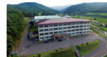
岩手県 いわてけんりつくずまき 岩手県立葛巻高等学校

世界自然遺産・知床半島のオホーツク海に面した港町。「知床学」で、地域への理解を深め、探究心を養う。