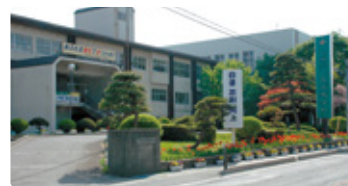
山形県 やまがたけんりつおくに 山形県立小国高等学校

「北緯40度ミルクとワインとクリーンエネルギーの町」で、地域と生徒が一丸となって未来を考える。