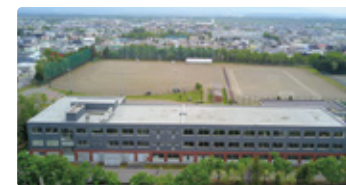
北海道 ほっかいどうしゃり 北海道斜里高等学校

そば生産量日本一のまちの実践的な「六次産業化教育」で、生産、加工、流通・販売を一貫して学ぶ。