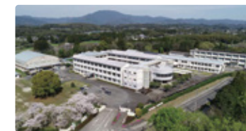
鹿児島県 かごしまけんりつさつまちゅうおう 鹿児島県立薩摩中央高等学校

神話と伝説が色濃く残り、世界農業遺産にも認定されている高千穂町を舞台にグローバルな学びを。