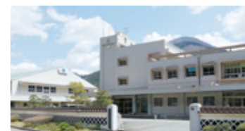
岩手県 しまねけんりつつわの 岩手県立津和野高等学校

全国高校生マイプロジェクトアワード常連校!本物のキャリア教育で自分の興味関心を深めるスペシャルチャレンジ留学。