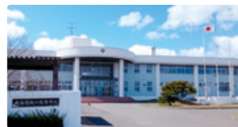
北海道 ほっかいどうむかわ 北海道鶴川高等学校

地域をキャンパスとする「むかわ学」、特性を伸ばす少人数学習で、これからの社会で求められる創造力を。