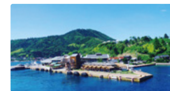
岩手県 しまねけんりつおきとうぜん 岩手県立隠岐島前高等学校

島親からつながる、一見すると「めんどくさい」が、価値観を広げ、おもしろいを増やす。