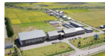
北海道 ほっかいどうほろかない 北海道幌加内高等学校

地域をキャンパスとする「むかわ学」、特性を伸ばす少人数学習で、これからの社会で求められる創造力を。