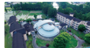
三重県 みえけんりつすばらがくえん 三重県立昂学園高等学校

ユネスコエコパーク登録の大台町。「あなた」が挑戦し、「あなた」を変えるサポートができる学校。