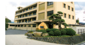
岩手県 しまねけんりつたいとう 岩手県立大東高等学校

ユネスコエコパーク登録の大台町。「あなた」が挑戦し、「あなた」を変えるサポートができる学校。