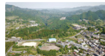
宮崎県 みやざきけんりつたちほ 宮崎県立高千穂高等学校

生活するのは霧島山麓の大自然です。ここに全国から集まる地域みらい留学生20名をはじめ地域や国内外の人とのつながりを創る環境がある飯野高校です。