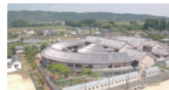
宮崎県 みやざきけんりつしいの 宮崎県立飯野高等学校

四季折々に美しい棚田とアユの住み清流を有する「水と大地の学び舎」。ITで地域や世界とつながる。