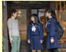
地域のかたと話す機会が多い

人前が出るのがあまり得意な方ではなかったのですが、津和野市の地域留学のコーディネーターさんに「場数を踏むことだよ」と背中を押していただき、留学中は自分の意見を言う場に取って自分を置き、積極的に人前で話をするよう頑張りました。おかげで、留学先の先生からも、帰省した時には両親からも、「明るく積極的になったね」と言われるようになりました。自分から留学に出たことで、世界が広がりました。これからは新たな場に積極的に身を置きながら、自分が経験したことも伝えていきたいと思えます。