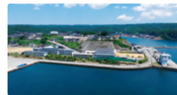
石川県 しかわけんりつのと 石川県立能登高等学校

子どもを伸び伸び育てる「まなびの土壤」がある地域で、大学や地元企業を巻き込んだカリキュラムを学ぶ。