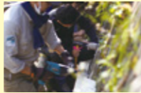
世界遺産の知床での魚道作りにも参加

留学に行かなかったら、ある意味で決まったレールの人生しか思い描けなかったかもしれません。両親は教員ですが、元々教員への関心は高くありませんでした。しかし、学びの形が多様であると気づき、教育への関心は強くなりました。大学では、教育と地域について、多様な研究をしている人たちと一緒に勉強したい。行きたい学校も決まり、総合型選抜の準備をします。子どもが地域のことを学ぶことで地域おこしにつながると感じたことをもとに、将来は地元で教育に関わりたくと考えています。