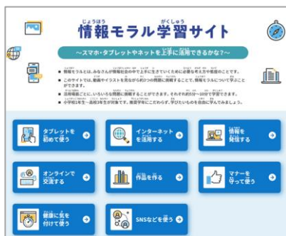
トップページ 画面