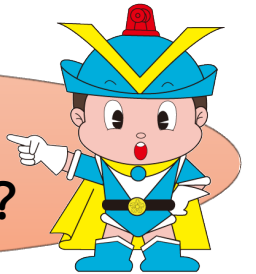
大阪府警マスコット フークン