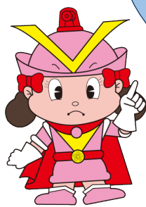
大阪府警マスコット ケーちゃん

便利な機能（アプリ）がたくさんあり、今や生活に欠かせないスマホ！ しかし、使い方を間違えると被害者にも加害者にもなってしまいます。