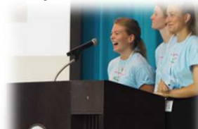
【世界高校生水会議2018年7月】