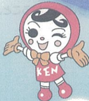
人権イメージキャラクター 「人KENあゆみちゃん」