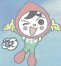
人権イメージキャラクター 「人KENまもる君」