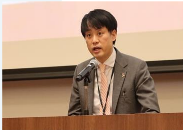
【労働者協同組合法周知フォーラムでの挨拶】