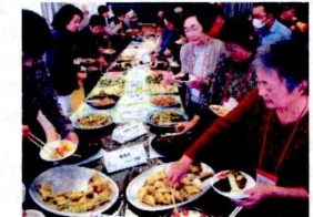
「ほのぼの・食べよう・おしゃべり会」

自慢の手料理（郷土料理）、90名の地域の方が参加し、食べて交流すること、ワーカーズコープ中志津の取り組みを発表しました。