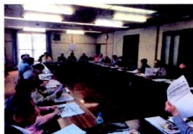
「しごとおこし懇談会」

自慢の手料理（郷土料理）、90名の地域の方が参加し、食べて交流すること、ワーカーズコープ中志津の取り組みを発表しました。