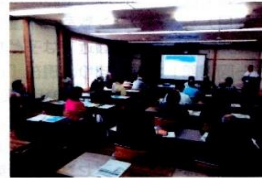
「クローズアップ現代自治会編」

話し合いの中は全体の会議では10回以上、①居場所（カフェ）②暮らしのサポート③協同農園といったグループに分かれての部門会議も多数行い、何度も何度も話し合いながら6月あたりから健康麻雀教室の開催（60名の登録）、協同農園（90坪の農地を借りて畑づくり）、そして11月3日にスタートのプレ企画として、ワーカーズコープ中志津のメンバー、中志津地域の方が自慢の料理を一品持ち込んで交流する食の文化祭として「ほのぼの・食べよう・おしゃべり会」を開催し、40品以上の