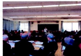
「しごとおこしセミナー」