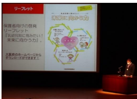
実践報告会の様子

※ 未来に向かう力（非認知能力）：「目標に向かってがんばる力」「気持ちをコントロールする力」「人と関わる力」など、自分や他者と折り合いをつける力。乳幼児期にその核となる部分が形成され、認知能力とともに、子どもの将来にとって大切な力。