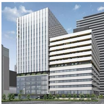
▲Nakanoshima Gross イメージ