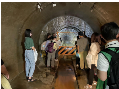
【排水トンネル見学の様子】