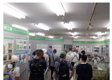
【資料室の見学の様子】