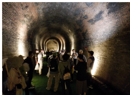
【旧国鉄関西線 亀の瀬トンネル見学の様子】