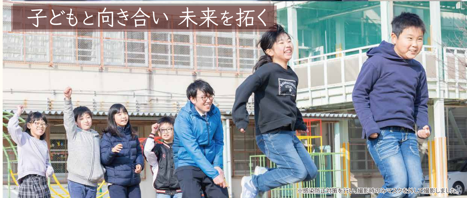
※感染防止対策を行い、撮影時のみマスクを外して撮影しました。