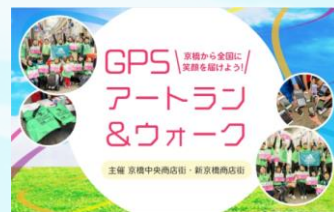
GPSアートランの広報