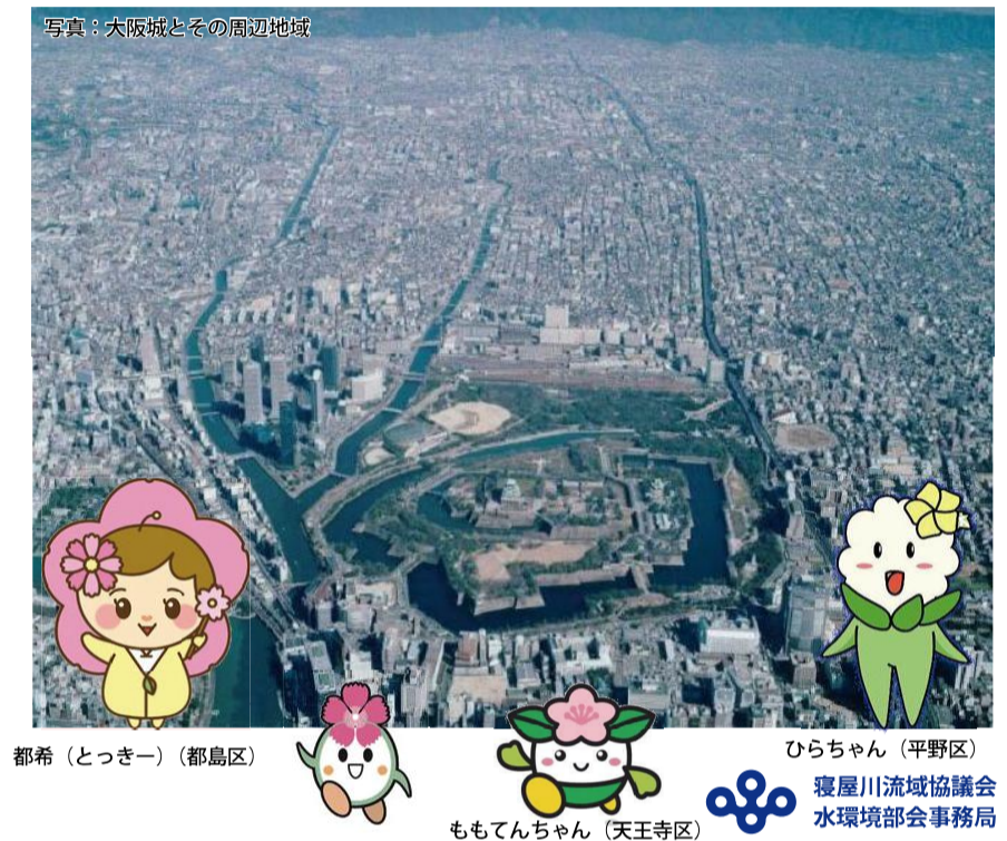
山折り③ なっぴー (東住吉区) 寝屋川流域協議会 水環境部会事務局