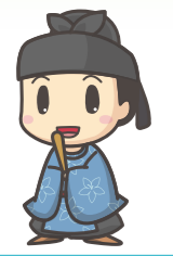
大阪府太子町公式マスコットキャラクター たいしくん

近鉄「上ノ太子駅」から太子町役場までは約2.2km 徒歩約25分・車で約8分だよ。目安にしてね!