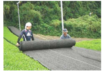
茶の被覆作業の実施