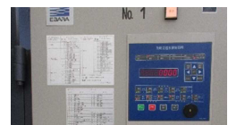
環境制御盤の導入