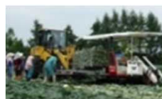
機械化体系の導入