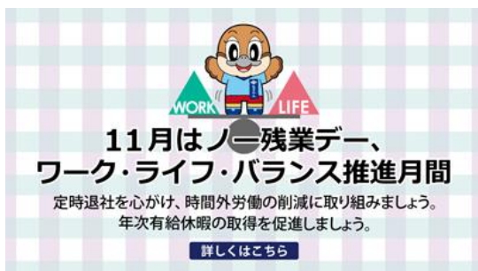
大阪府ホームページトップページのアイコン