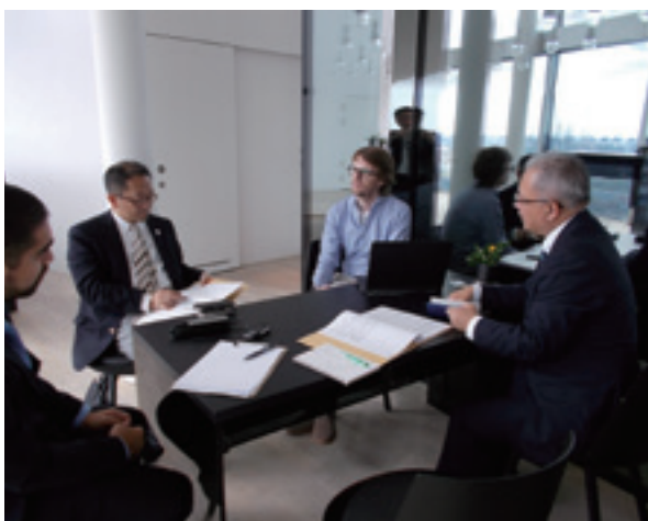
エルプフィルハーモニーでの打合せ