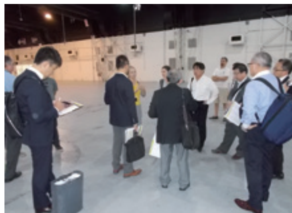
コスタ・サルゲロの視察

訪問がサミット開催直後であったこともあり、G20のため政府が組織した事務局(G20テクニカルユニット)やブエノスアイレス市役所を訪れ、直接担当者からサミット開催時の規制・警備状況や各関係機関の対応等の有益な話を聞くことができた。また、サミット本会場として使用されたコスタ・サルゲロをはじめ、コロン劇場、ビジャ・オカンポ、ブエノスアイレス・ラテンアメリカ・アート美術館やパルケノルテ(メディアセンター)等を視察した。