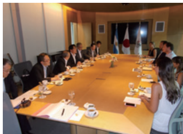
ブエノスアイレス市役所での打合せ