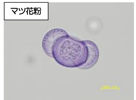
マツ花粉 大きさ 50 μm 前後、 両端に気嚢と呼ばれる 2 個の空気袋が ある。