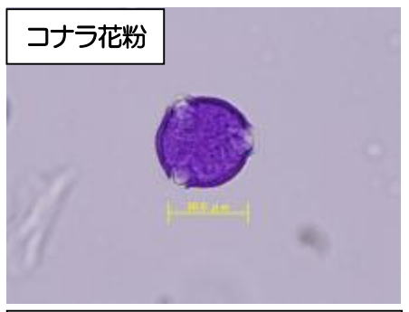
コナラ花粉 大きさ 20~40 μm、 3~4 孔溝粒、表面に 1 μm 前後の刺状 紋がある。