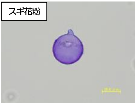
スギ花粉 大きさ 30~40 μm、 パピラという鉤状の突起部がある。