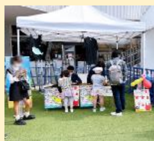
（マイバッグづくり体験）