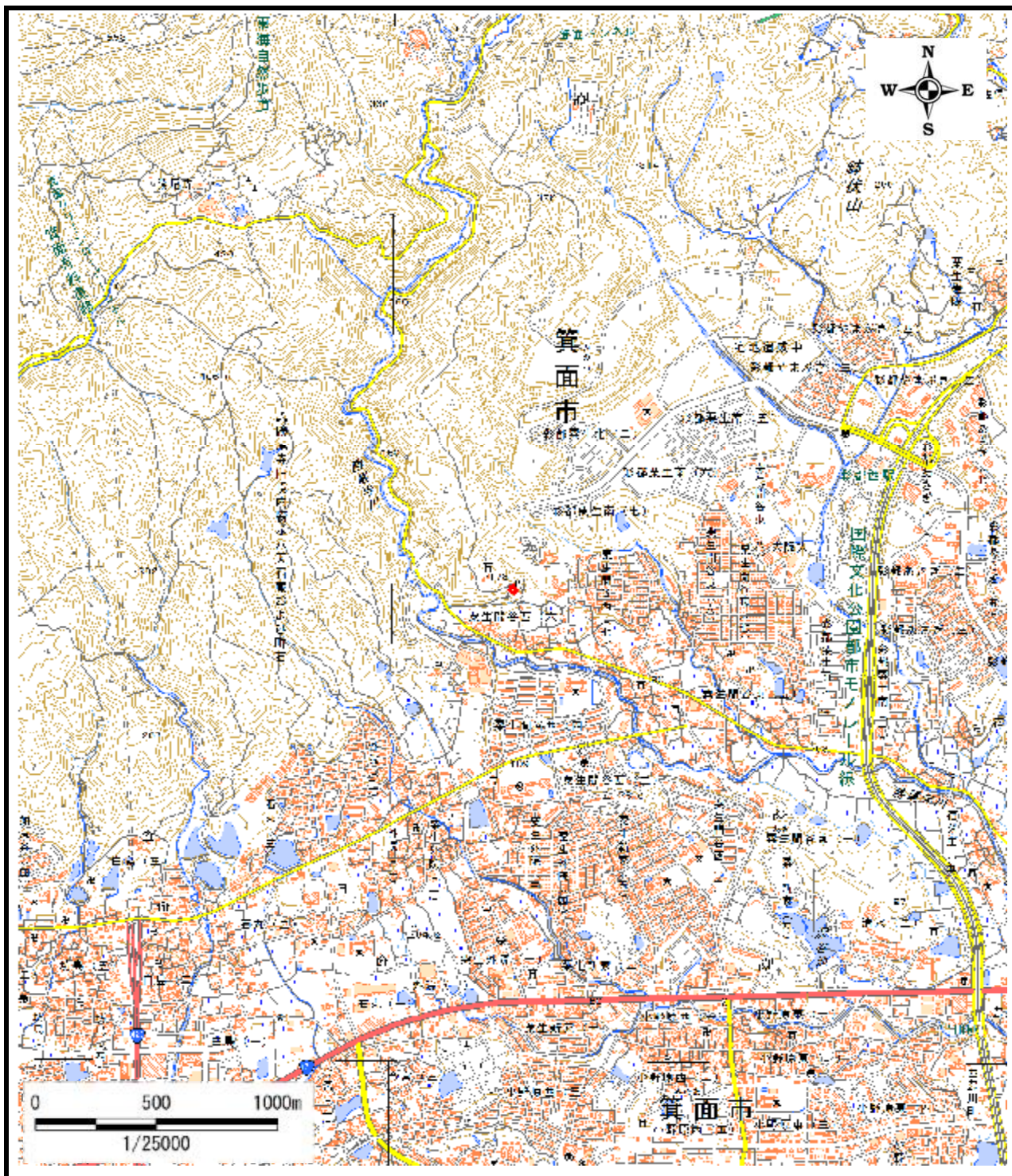
区域指定箇所概略位置図(1/25,000)