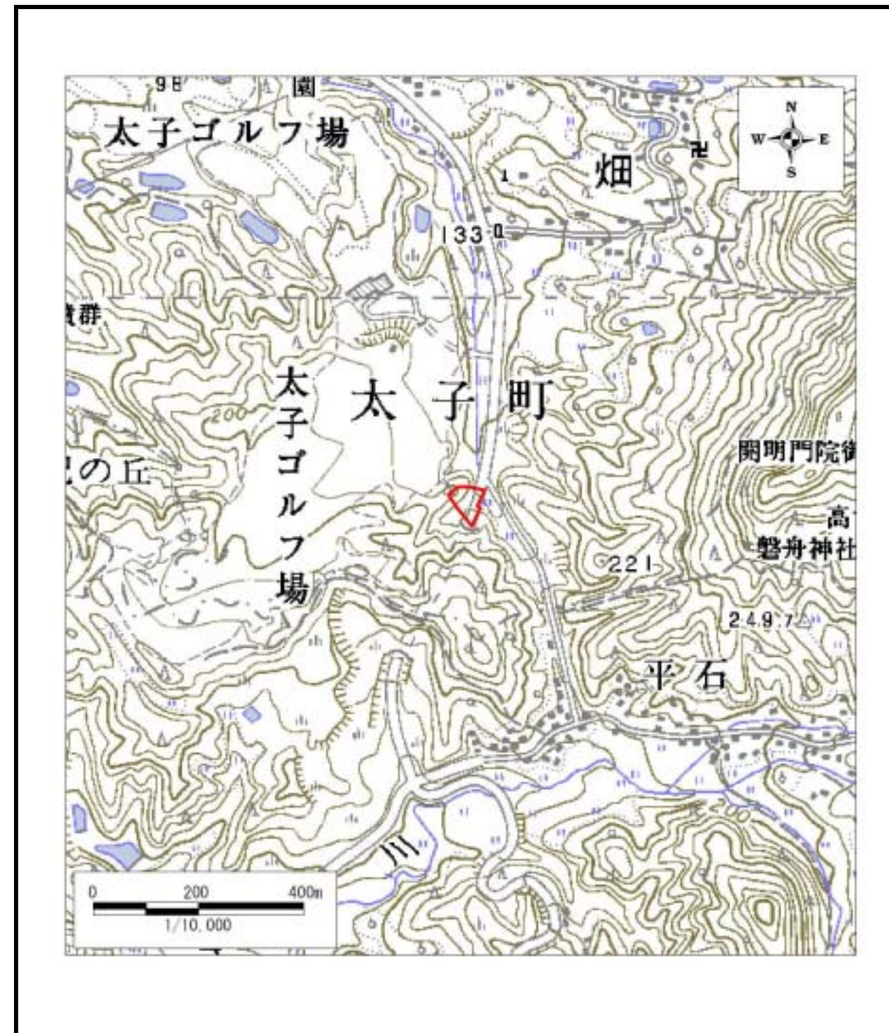
区域指定箇所位置図(1/10,000)