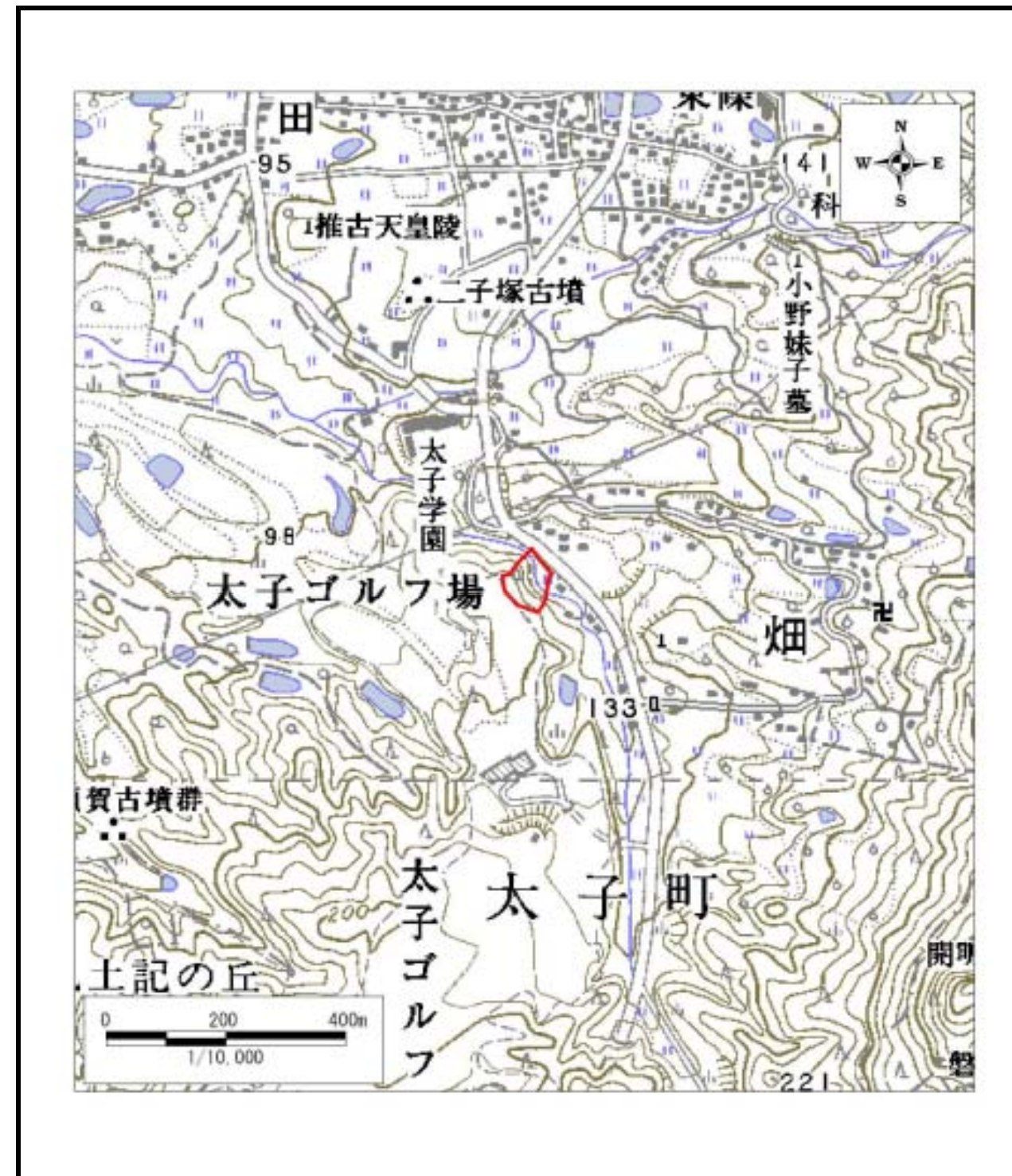
区域指定箇所位置図(1/10,000)