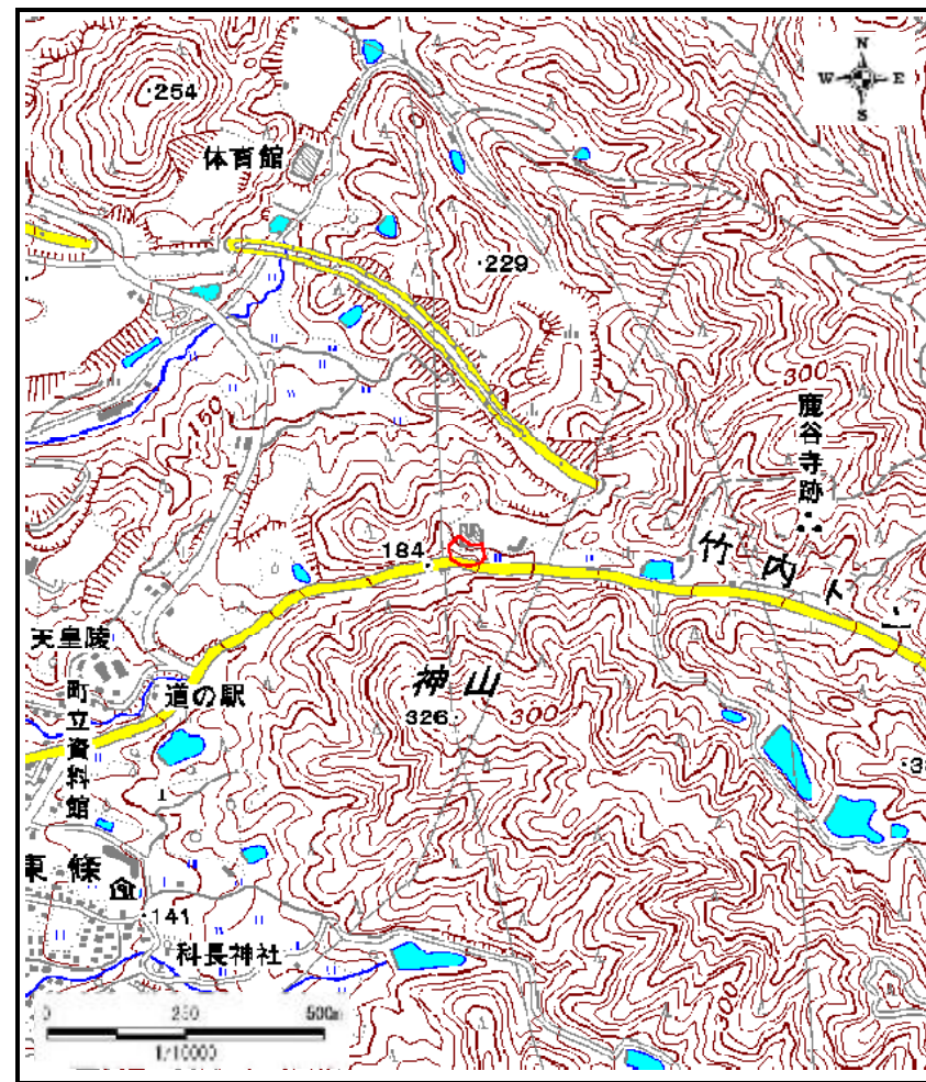
区域指定箇所位置図(1/10,000)