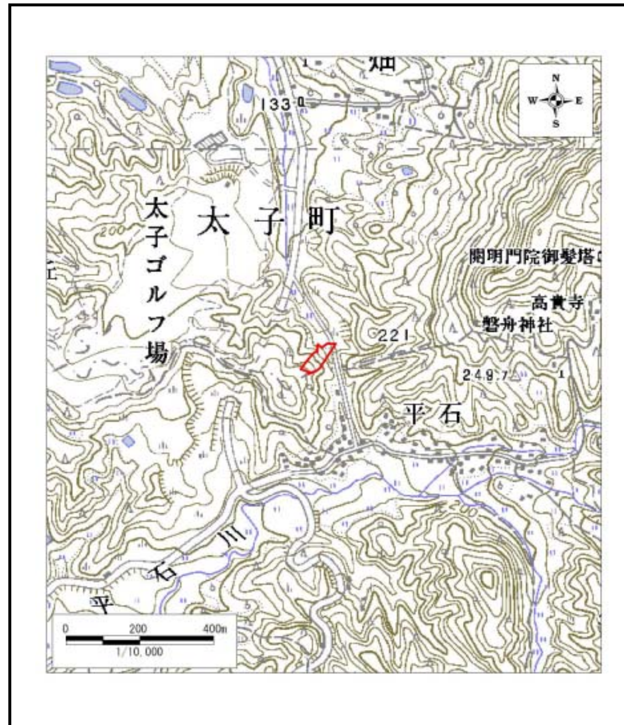
区域指定箇所位置図(1/10,000)