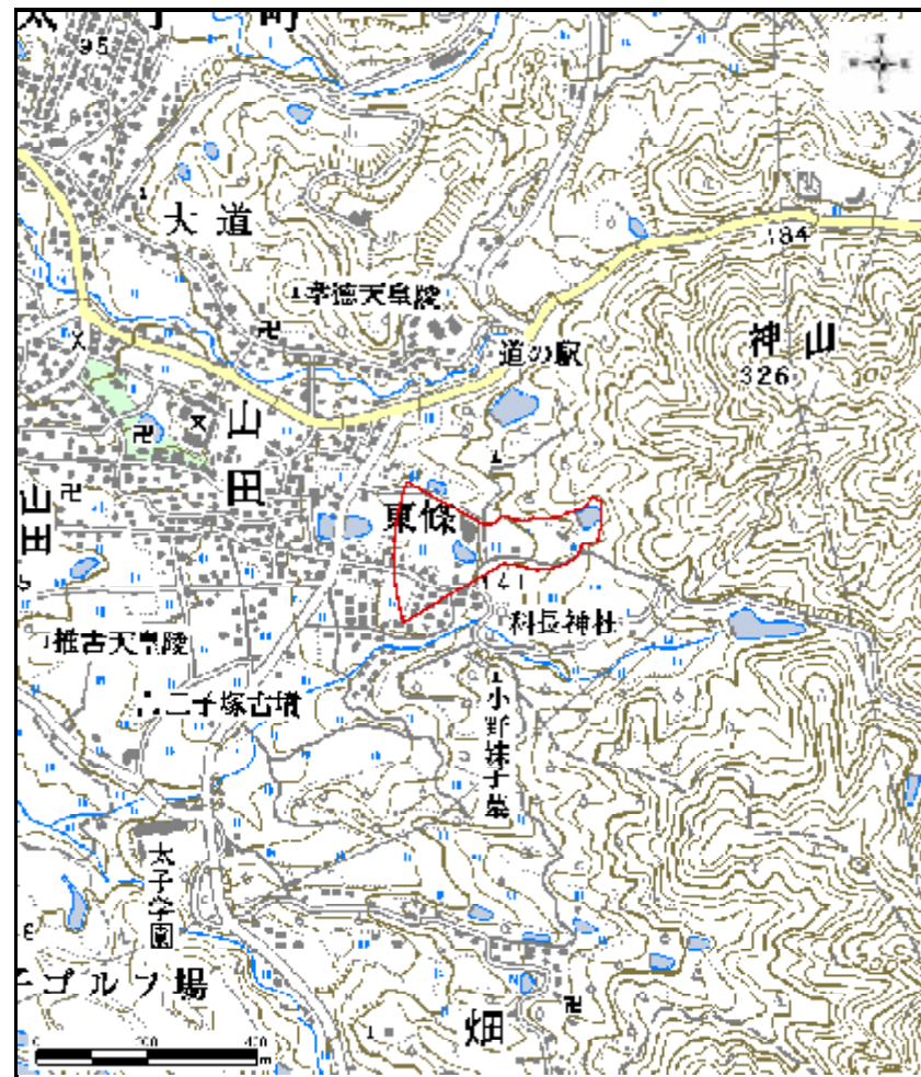
区域指定箇所位置図(1/10,000)