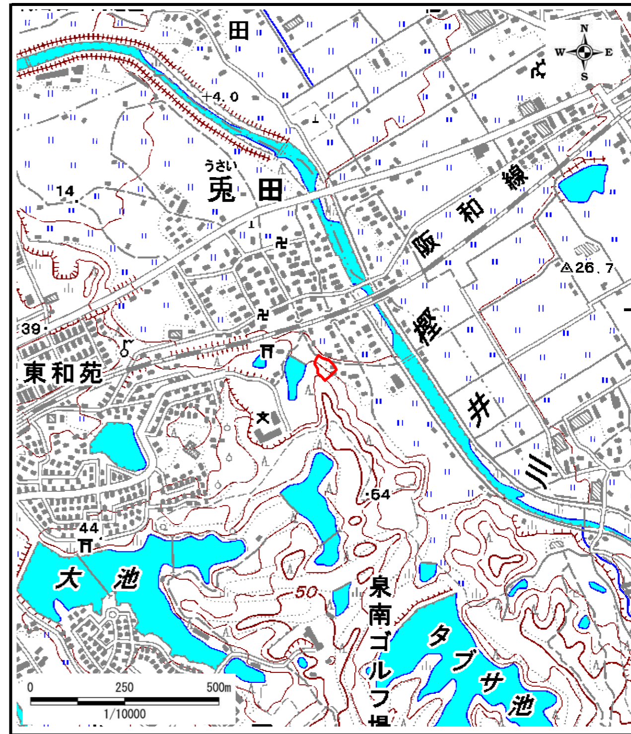
区域指定箇所位置図(1/10,000)