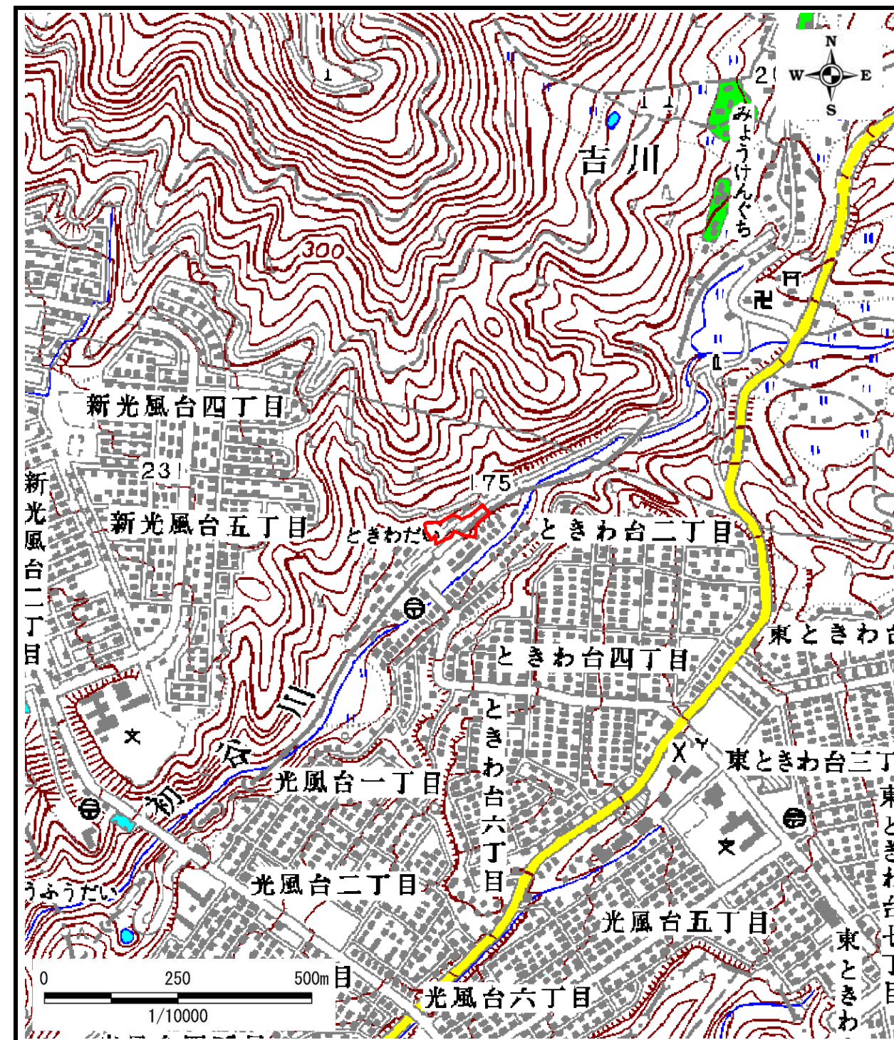
区域指定箇所位置図(1/10,000)