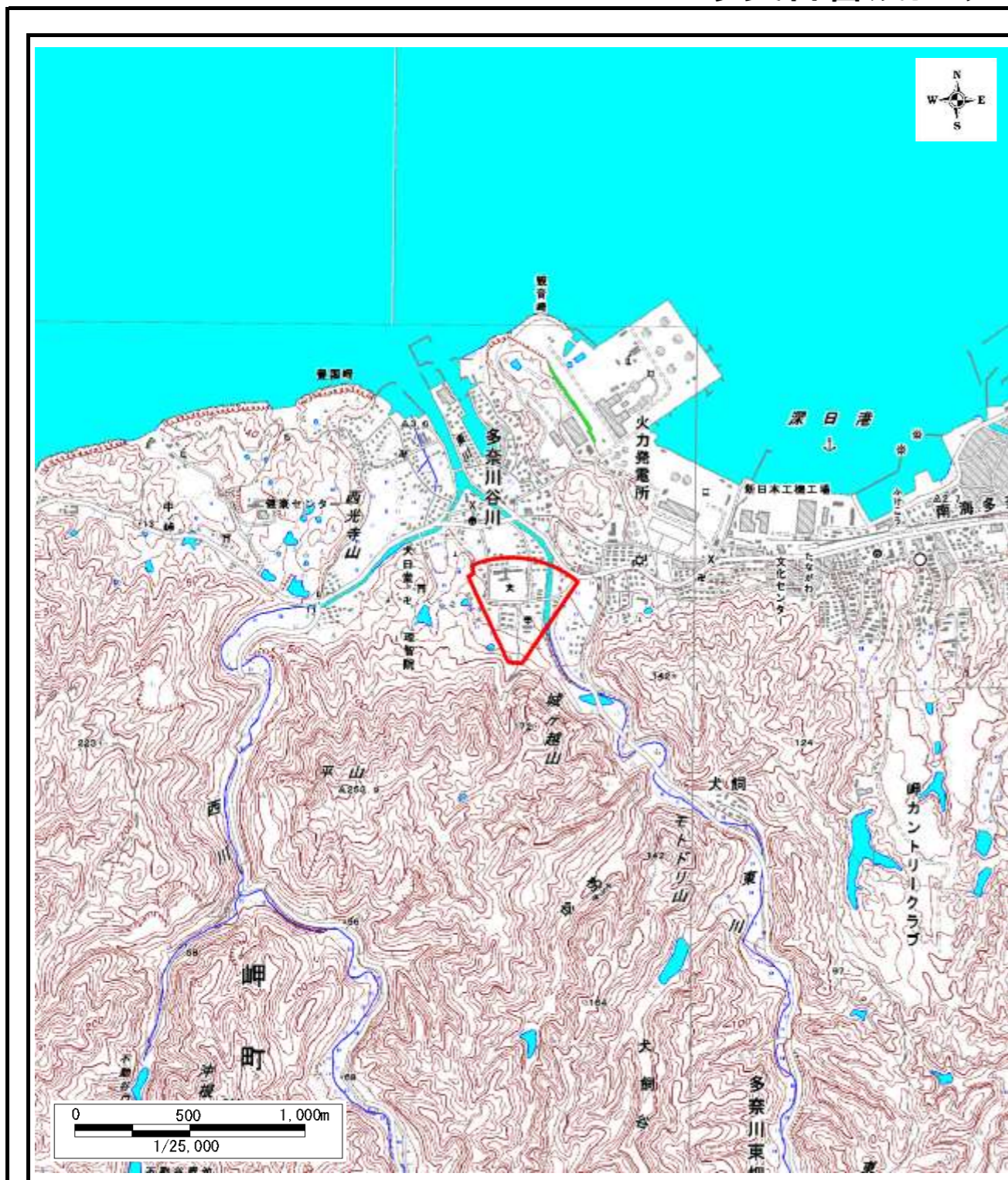
区域指定箇所概略位置図(1/25,000)