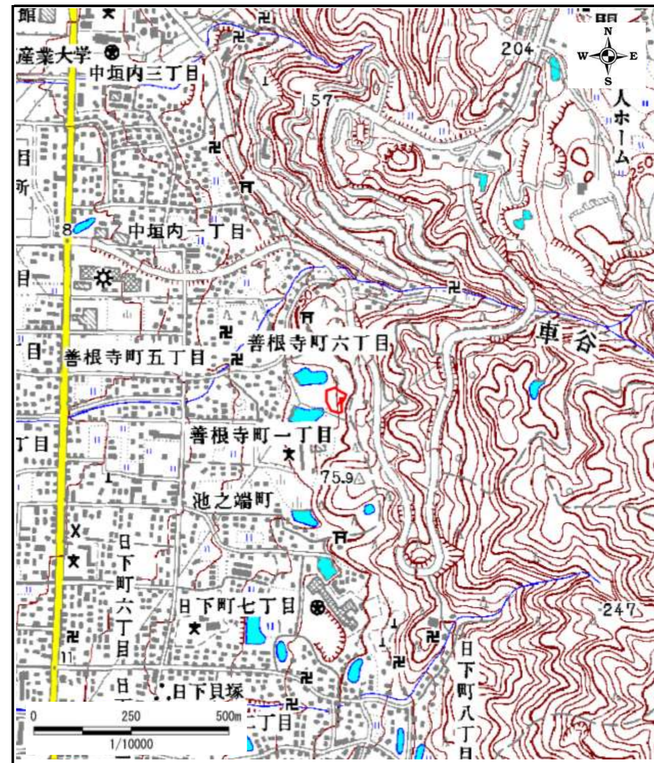
区域指定箇所位置図(1/10,000)