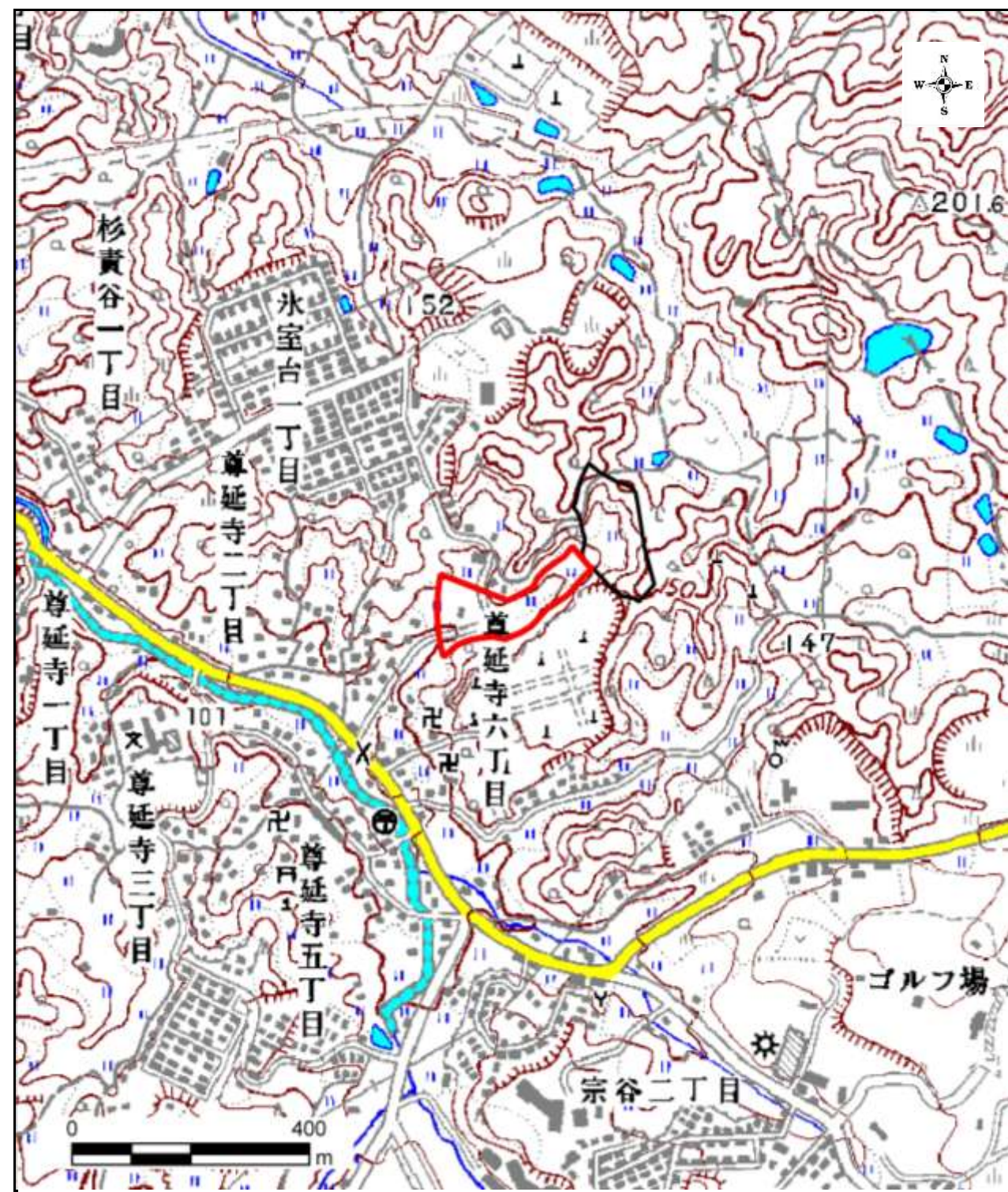
区域指定箇所位置図(1/10,000)