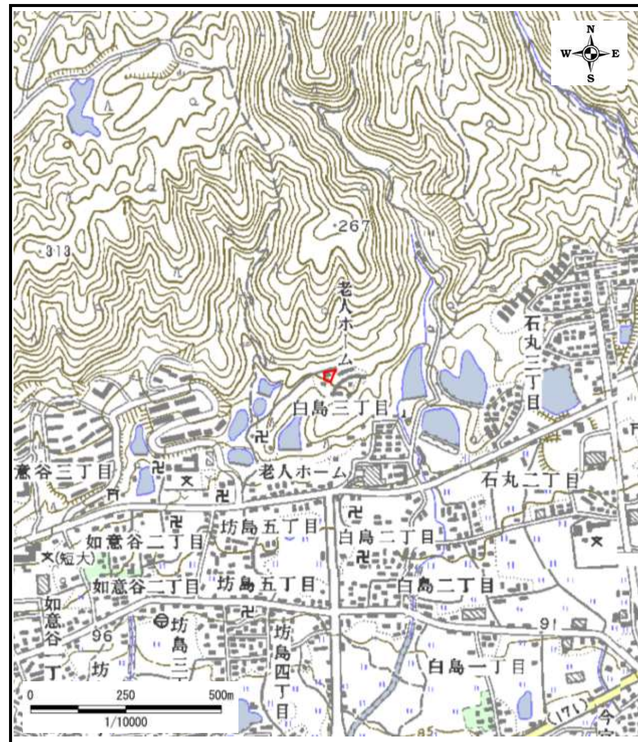
区域指定箇所位置図(1/10,000)