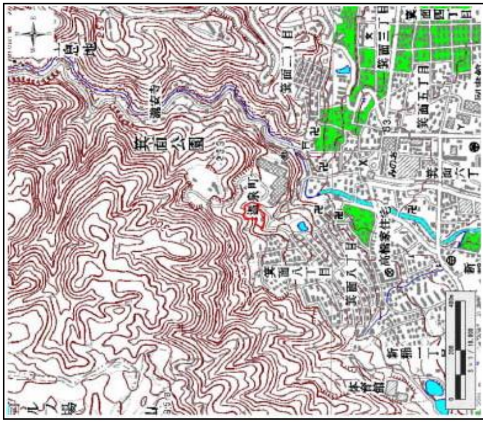
区域指定箇所位置図 (1/10,000)