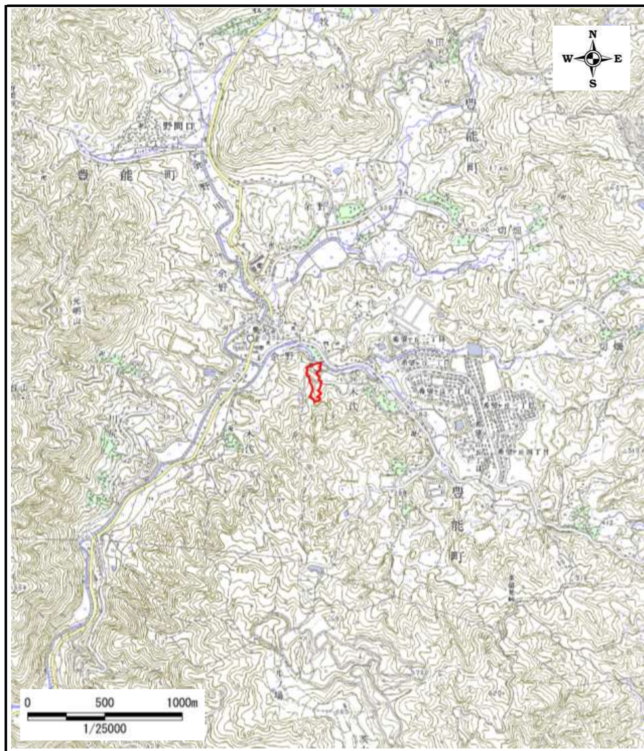
区域指定箇所概略位置図(1/25,000)