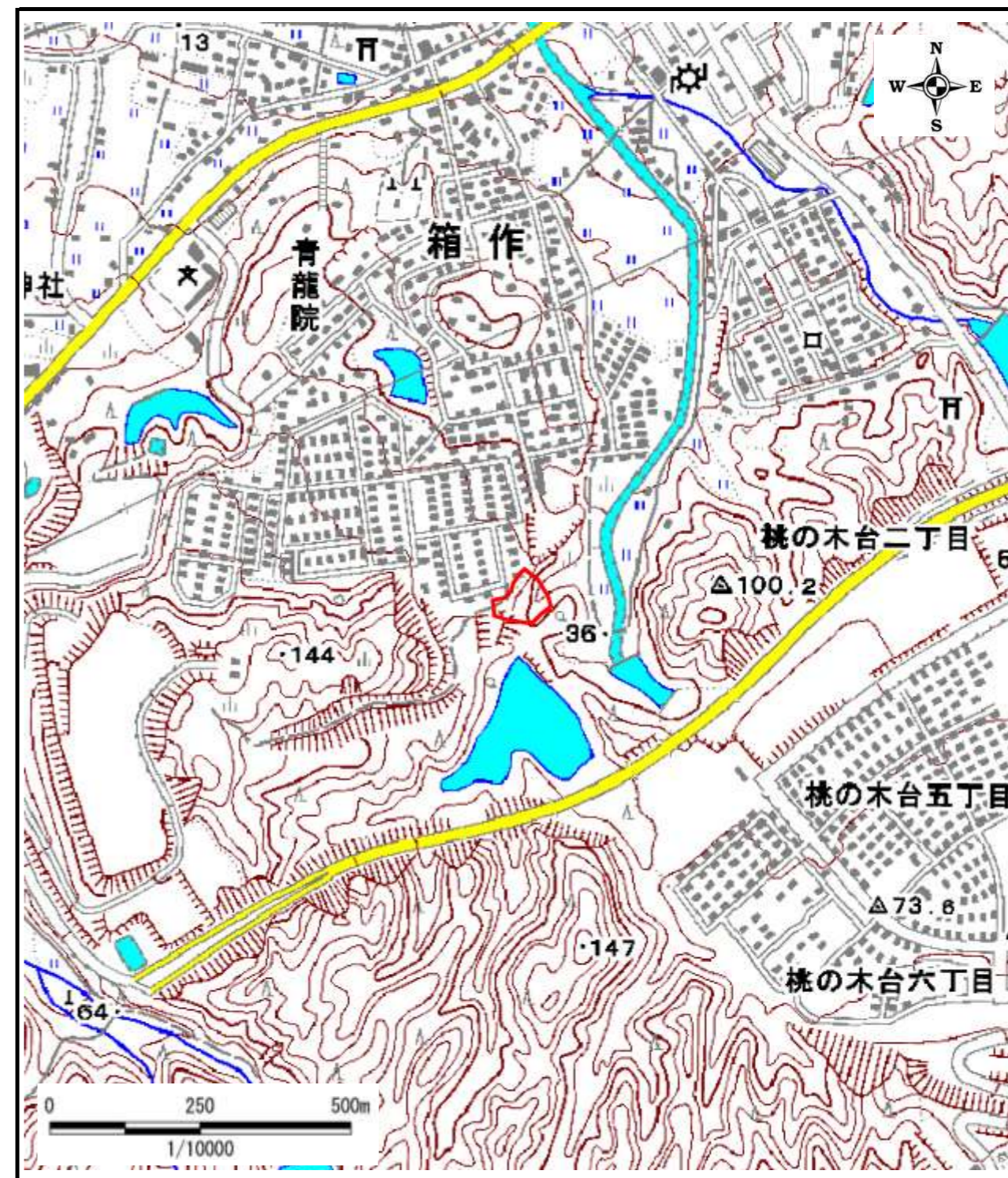
区域指定箇所位置図(1/10,000)