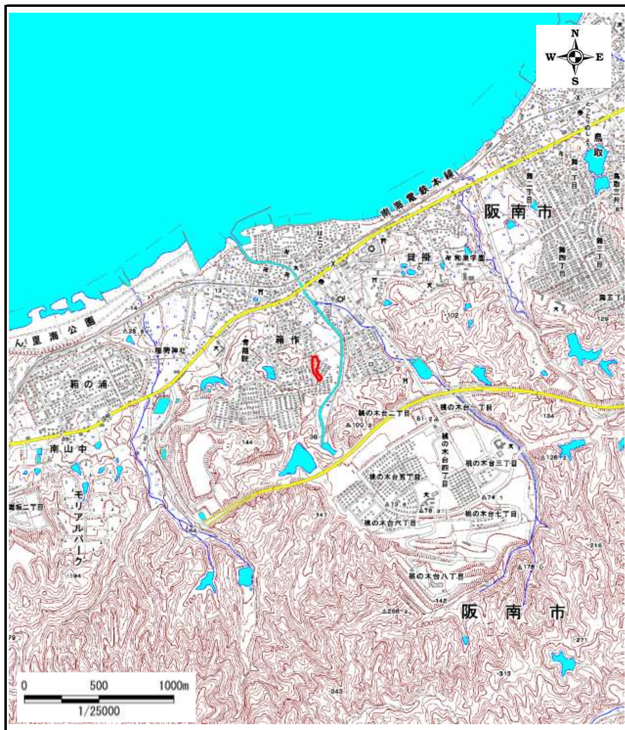
区域指定箇所概略位置図(1/25,000)